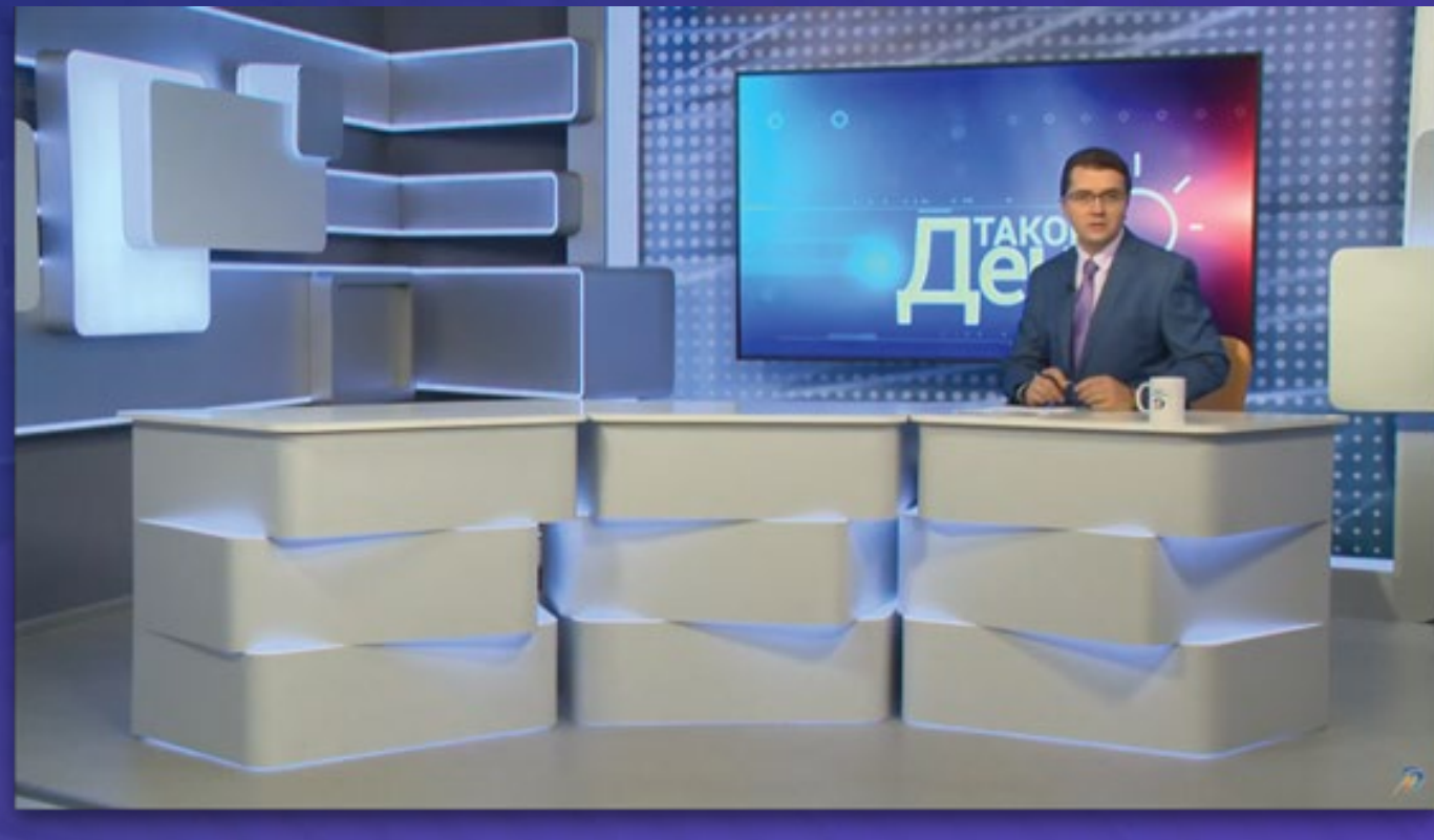
Новости (проект «Такой день»)